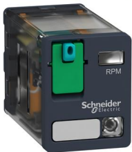
# de parte: RPM22BD Cod SAP: RELT218