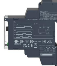
# de parte: RE22R1AMR Cod SAP: RELT107A

RE22R1AMR RELE TEMPORIZADO 0.1-300h.24-240 AC/CD ON DELAY