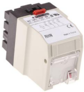
# de parte: RHN412J Cod SAP: RELT094A